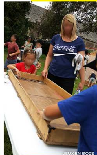
JEUX EN BOIS