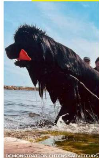
DÉMONSTRATION CHIENS SAUVETEURS

Visitez le terriil grâce à un guide de l'office de tourisme et sa formule express à 11h et 15h - Gratuit [Réservation obligatoire].